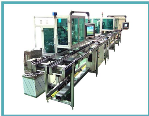
Armature Ass'y Line