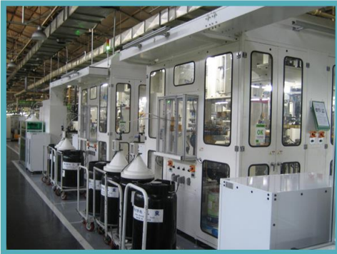
Stator Ass'y Line