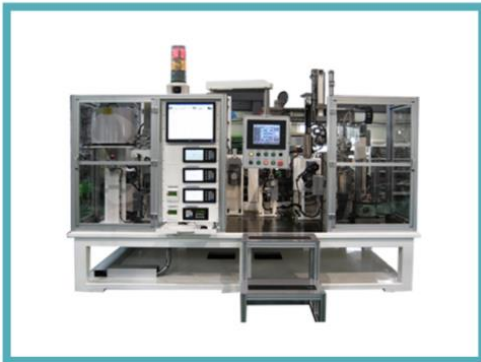
CAM Shaft Ass'y M/C