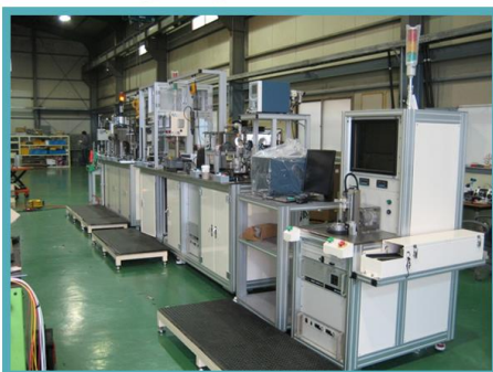
Water Pump Ass'y Line