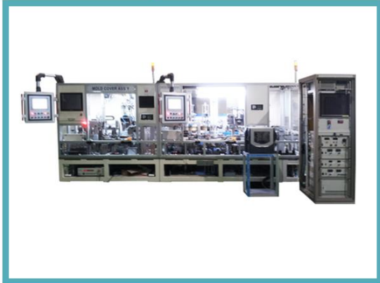
ABS Motor Ass'y Line